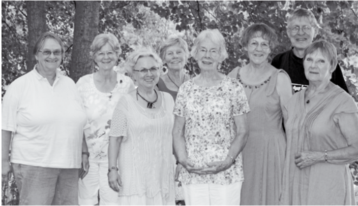
Das „Klönstuv“-Team lädt Sie herzlich dienstagnachmittags zu Kaffee und Kuchen ein!

Am letzten Dienstag im Juli haben alle ehrenamtlichen Helferinnen das herrliche Wetter bei einem kleinen „Sommerfest“ draußen am „Bootshaus“ am Lütjensee genießen können. Ohne Zeitnot liess man die vorsommerliche „Klönstuv“-Saison Revue passieren.